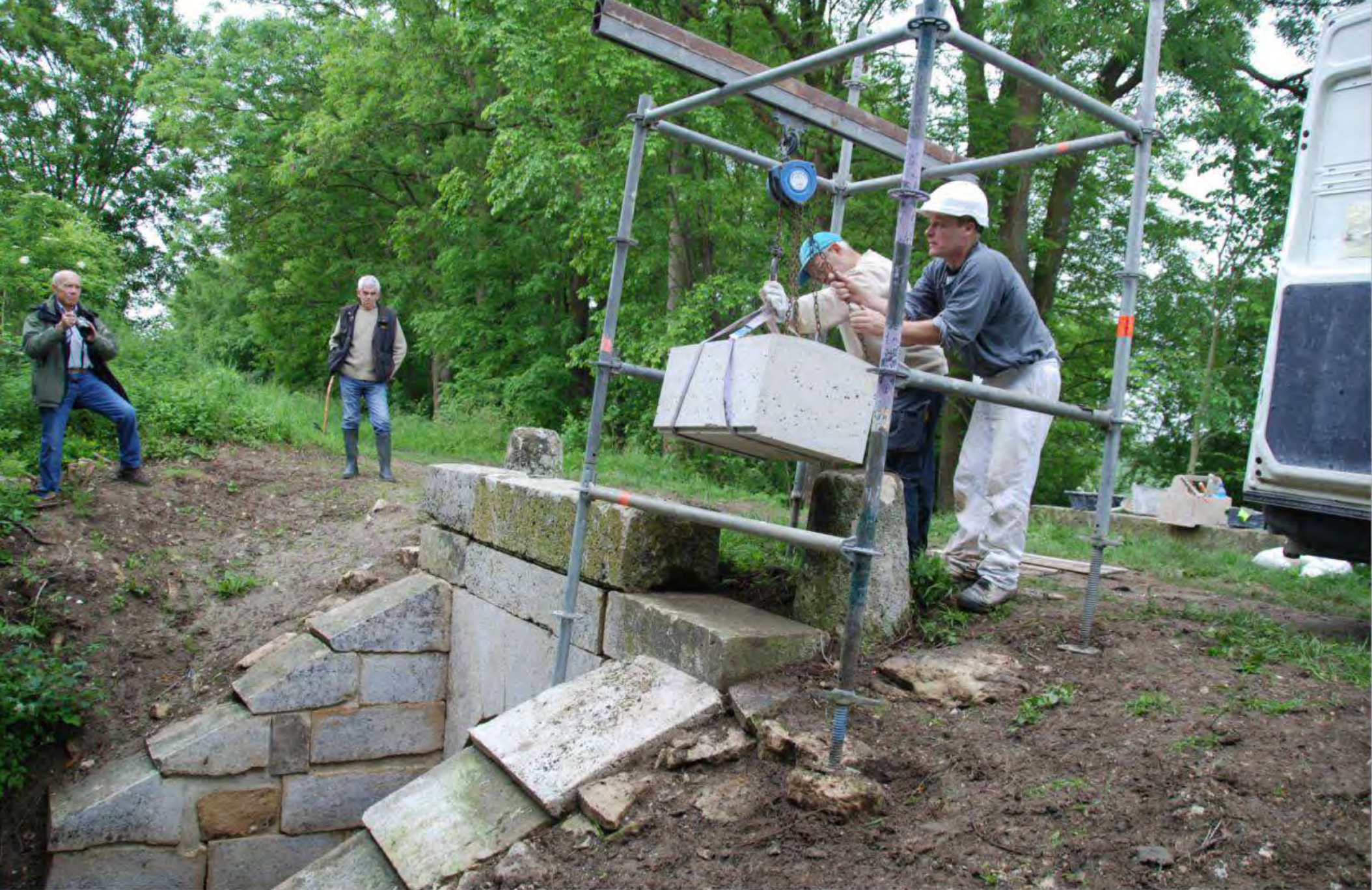
Pose de la pierre taillée par les Ateliers de Coubertin à Saint-Rémy-les-Chevreuse