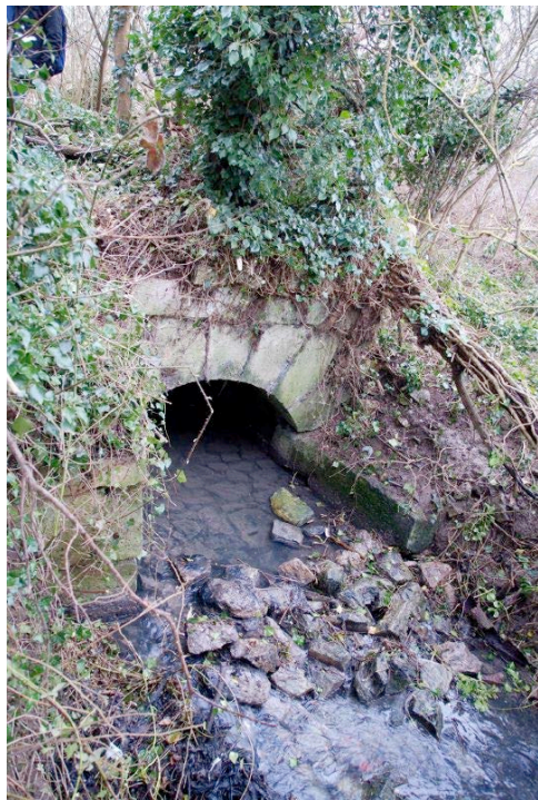
Caractéristiques de la reconstitution du mur d'enceinte en lisière de la forêt de Marly